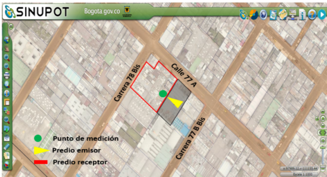
Figura 1. Ubicación del predio emisor, receptor (Calle 77 A No. 77 B - 71) y punto de medición.

Nota 5 (**): Una vez realizada la búsqueda en el Sistema de Norma Urbana y Plan de Ordenamiento Territorial – SINUPOT, no se encontró la dirección verificada en campo (ver fotografía No. 2) y consignada en el Registro Único Empresarial y Social Cámaras de Comercio - RUES para el establecimiento industrial objeto de seguimiento, correspondiente a la Calle 77 A No. 77 B – 63. Por tanto, se procedió a localizar el predio visitado en la herramienta SINUPOT, evidenciando que se encuentra registrado bajo las nomenclaturas: Calle 77 A No. 77 B – 55 y Calle 77 A No. 77 B – 59 (ver Anexo No 6. Reporte SINUPOT); las anteriores todas válidas para identificar el predio de interés. Por tanto, se deja como válido el reporte SINUPOT anexo a la presente actuación técnica.